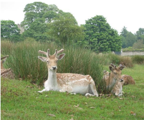
Nadja Blaser BGK Sektion Hirsche