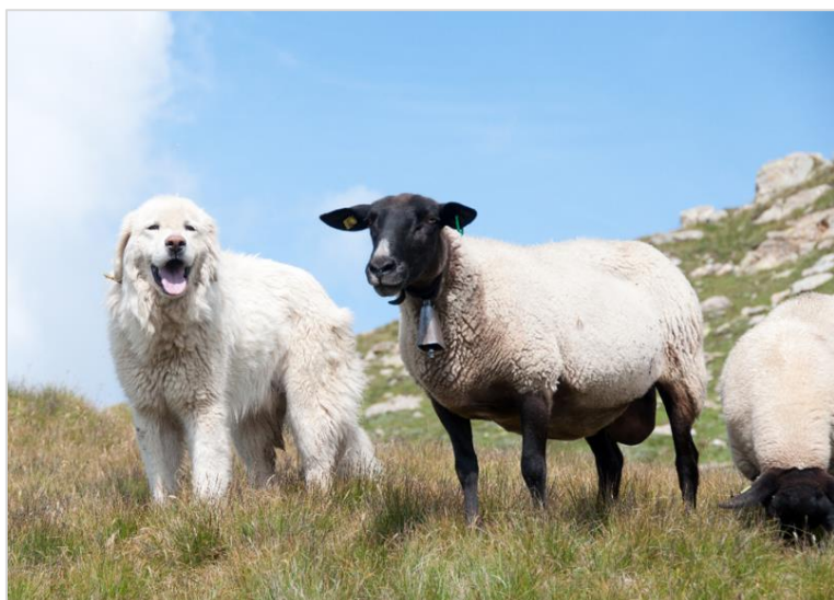
Les chiens de protection des troupeaux sont de plus en plus présents sur les alpages à moutons

Le nombre de membres de la section ovins a de nouveau légèrement augmenté en 2022.