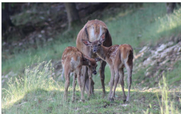
Des animaux calmes malgré les visiteurs dans l'enclos: les faons adoptent le comportement souhaité de leurs mères

En raison du classement de la kétamine dans le groupe des stupéfiants depuis 2019, la distribution du mélange Hellabrunner aux éleveurs de cervidés n'est plus autorisée, sauf s'ils démontrent leur compétence professionnelle en suivant avec succès une formation continue ad hoc. Depuis l'année dernière, le SSPR propose un cours sur le thème de l'immobilisation du gibier en parcs.