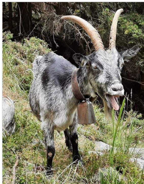
Hé, attendez-moi!

Les programmes sanitaires ont aussi requis beaucoup de temps. Le programme d'assainissement de la pseudotuberculose par exemple a de nouveau enregistré une augmentation du nombre d'exploitations participantes. Nous nous sommes aussi nouvellement engagés dans l'entremise de possibilités d'estivage pour les chèvres sérologiquement indemnes de pseudotuberculose. Les directives techniques afférentes ont été mises à jour en collaboration avec le comité de la section et approuvées par le comité du SSPR.