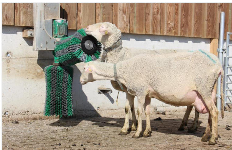
Les brebis laitières apprécient aussi les soins corporels