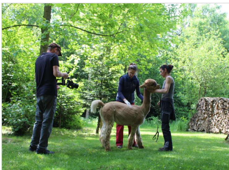
La section petits camélidés lors du projet vidéo «Achat d'animaux».

Au printemps 2022, la section a envoyé une newsletter sur le thème de la problématique des parasites dans l'élevage de camélidés du Nouveau Monde explicitement, en allemand, en français et en italien. Elle a également dirigé un projet vidéo supra-section sur le thème de l'achat d'animaux, pour lequel des séquences filmées spécifiques aux espèces animales ont été réalisées au cours de l'année, notamment pour les petits camélidés. La publication est prévue pour 2023.